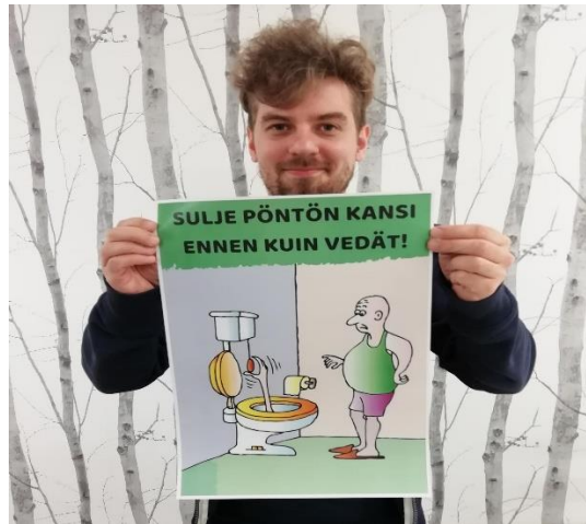
Koronaohjeita mm. vessoihin.

nuorisotyöntekijä osallistui nuorten kanssa mm. rentovälkkiin, nuorisovaltuuston toimintaan ja sekä 9. luokkalaisten opintomatkalle Riveria-ammattiopistoon. Etsivä nuorisotyöntekijä toimi aktiivisessa yhteistyössä Polvijärven nuoriso-ohjaajan kanssa ja vuoden loppu puolella he aloittivat yhdessä järjestämään muun muassa KOHU (kohtaa ja huomioi) -nuorteniltoja.